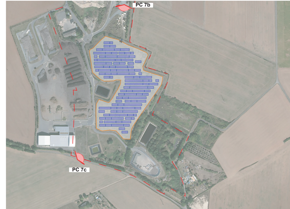
PLAN DE REPÉRAGE DES VUES